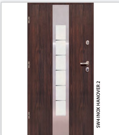
SW4 INOX HANOVER 2

Drzwi GWX 20. Popularne drzwi panelowe zewnętrzne z przeszkleniem GERDA GWX20, zgodnie z oczekiwaniami klientów zostały wzbogacone o nowe wzory. W kolekcji INOX wkomponowaliśmy inserty ze stali nierdzewnej, podkreślając nowy styl drzwi. Nowoczesne przeszklenia wykonane są z szyby P4, co gwarantuje odpowiednie zabezpieczenia antywłamaniowe. Panele dostępne są w wykończeniu laminowanym (drewnopodobnym), lakierowanym i drewnianym.