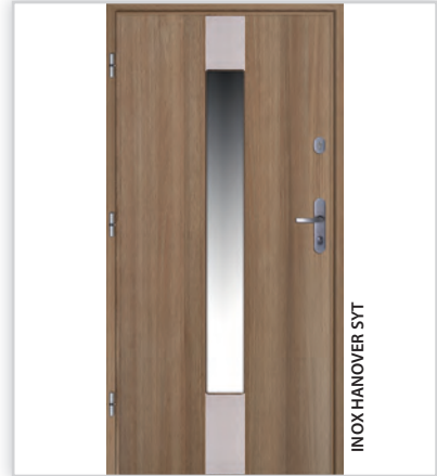
INOX HANOVER SYT

Drzwi GWX 20. Popularne drzwi panelowe zewnętrzne z przeszkleniem GERDA GWX20, zgodnie z oczekiwaniami klientów zostały wzbogacone o nowe wzory. W kolekcji INOX wkomponowaliśmy inserty ze stali nierdzewnej, podkreślając nowy styl drzwi. Nowoczesne przeszklenia wykonane są z szyby P4, co gwarantuje odpowiednie zabezpieczenia antywłamaniowe. Panele dostępne są w wykończeniu laminowanym (drewnopodobnym), lakierowanym i drewnianym.