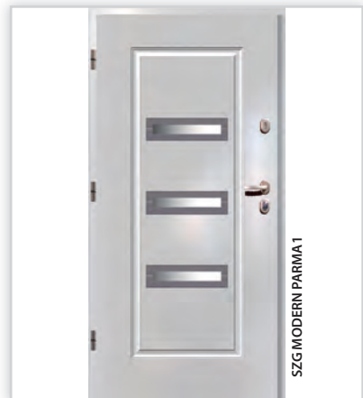
SZG MODERN PARMA 1

Drzwi TT Plus, TT Max. Dzięki zastosowanym rozwiązaniom konstrukcyjnym i materiałami najwyższej jakości, drzwi z grupy TT posiadają odporność na włamanie klasy RC2 lub RC2N. Zastosowanie podwójnego uszczelnienia skrzydła i ościeżnicy wpływa bardzo dobrze na izolacyjność drzwi oraz komfort użytkowania.